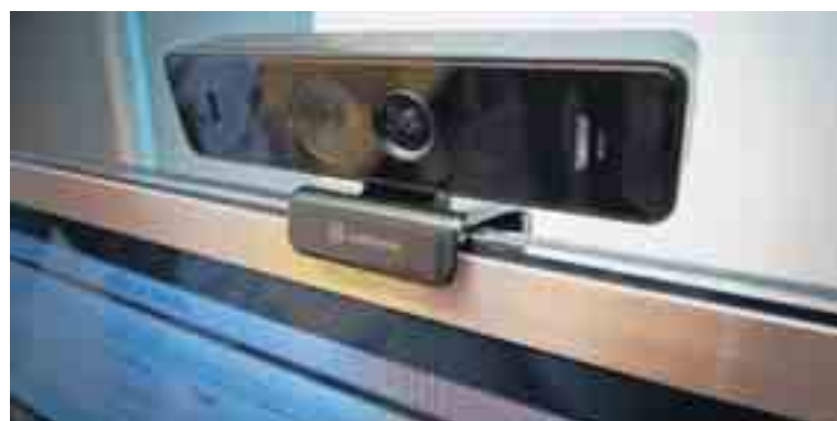
Prototype van cameratoestel.

Als toekomstplan schetst de ceo twee scenario's. 'Ofwel worden we een groot bedrijf en we geloven echt dat we tegen 2015 een onderneming van 100 miljoen euro omzet kunnen zijn. Dan trekken we naar de beurs. Maar als er een grote, strategische partner is die ons wil overnemen, dan zullen we er beslist naar kijken. Op dit ogenblik willen we van Softkinetic echter vooral een goed draaiend bedrijf maken. Vandaag verkopen we niet.'